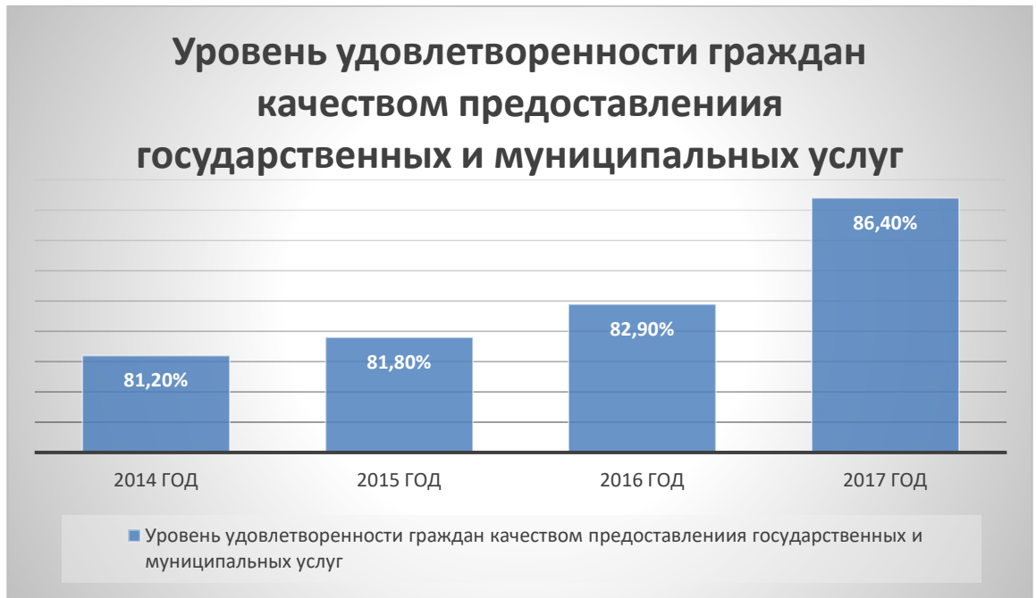
Рисунок 1.1 – Уровень удовлетворенности граждан качеством предоставления государственных и муниципальных услуг по итогам исследований 2014-2017 гг., %

Название рисунка располагается по центру, оформляется полужирным интервалом, размер шрифта – 14