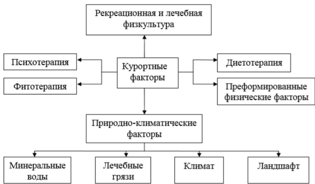
Рисунок 1 – Курортные факторы и их использование в лечебных и оздоровительных целях

Таблица или рисунок в тексте должны занимать не более одной страницы. Если аналитическая таблица или рисунок превышают одну страницу, их следует включать в Приложения.